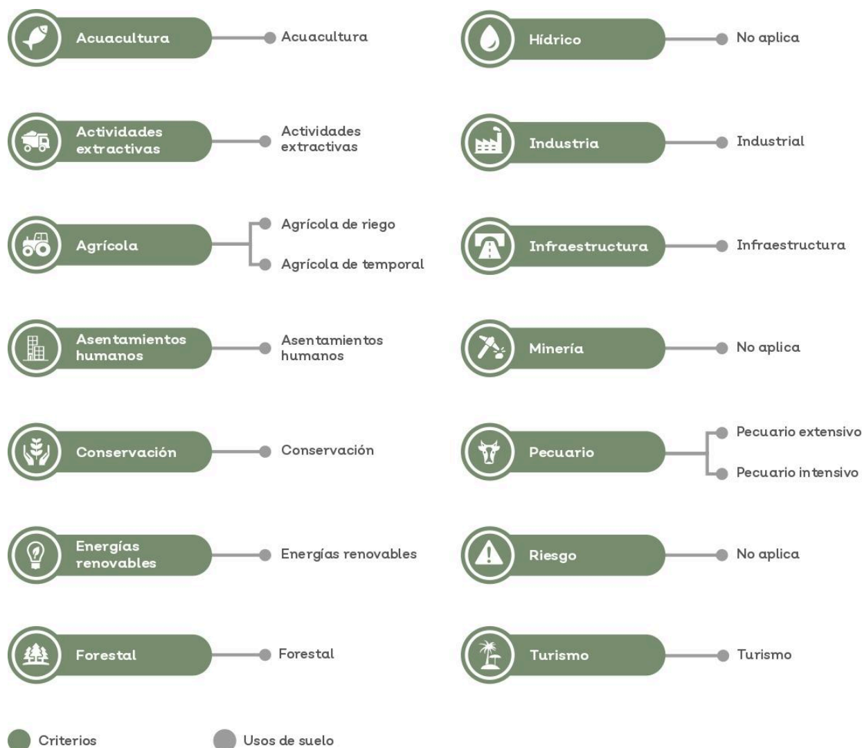
Gráfico C6.