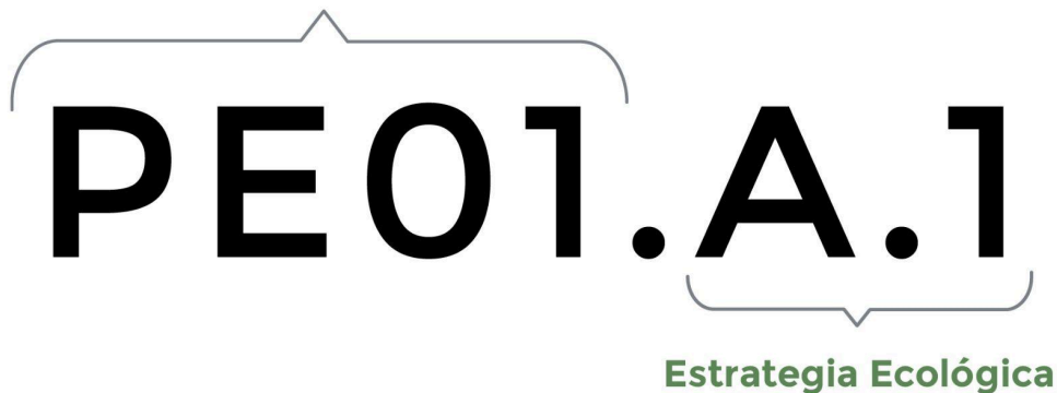
Gráfico C5.