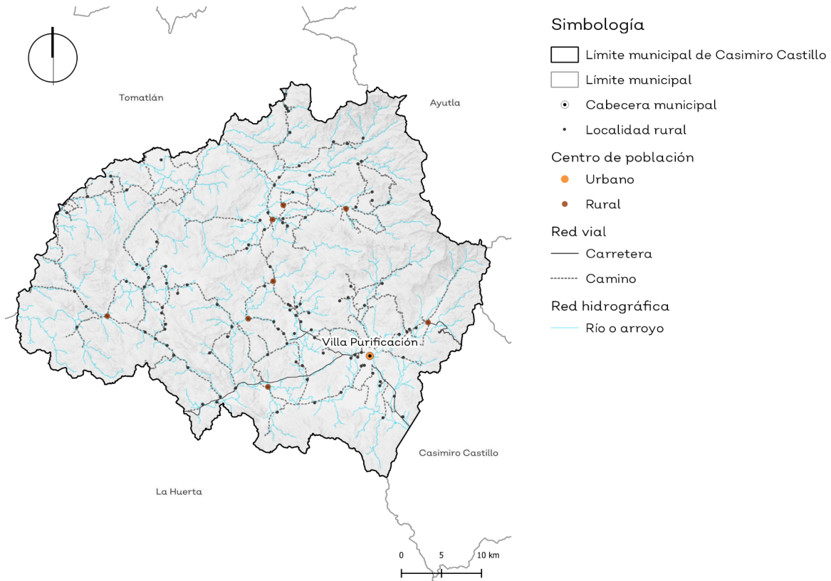
Mapa 1.