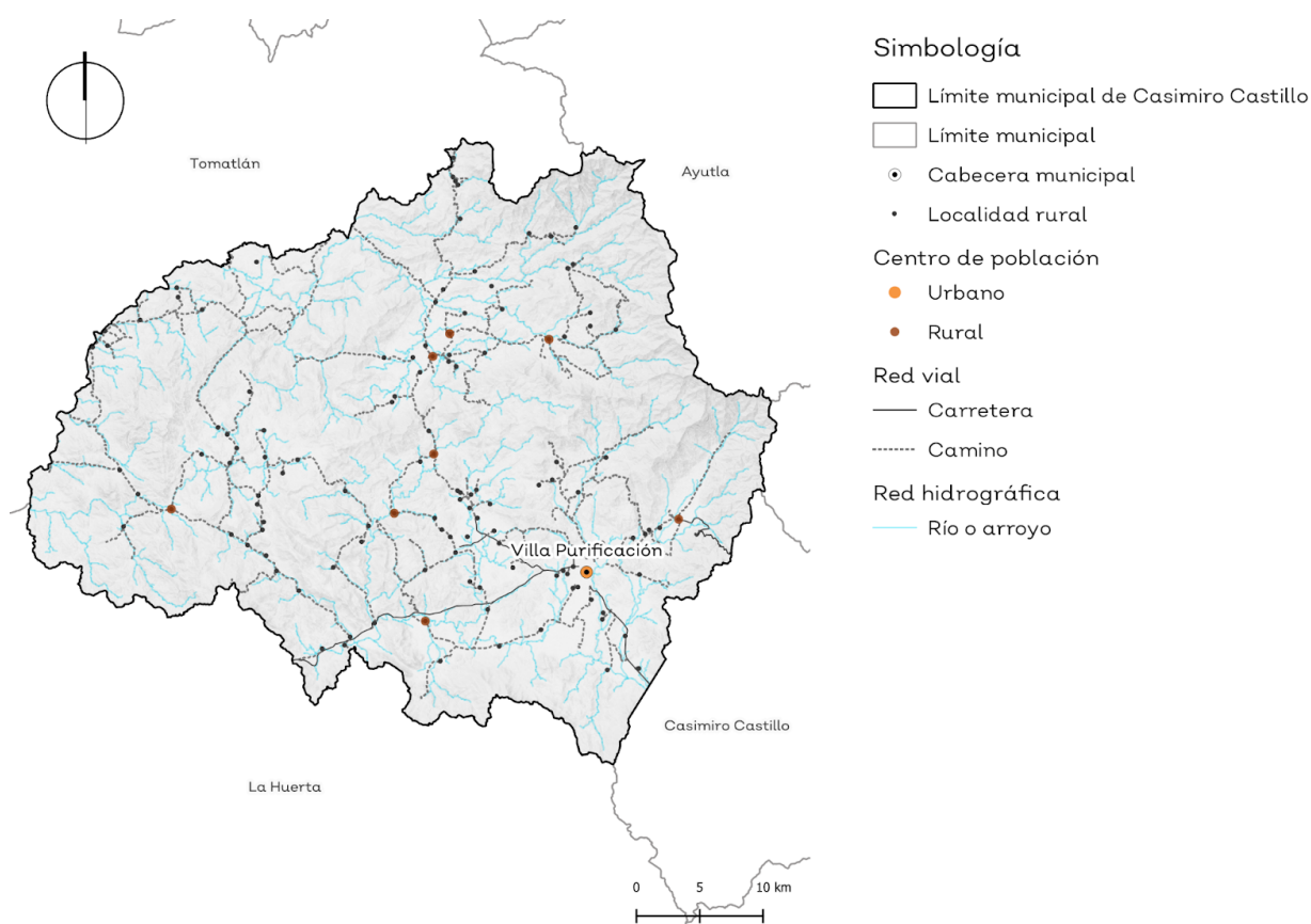
Mapa 1.