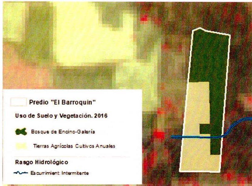
Figura 1. Capas vectoriales, como evidencia para revisión de controversia de COMPATIBILIDAD en Predios estimados para el cultivo de agave.