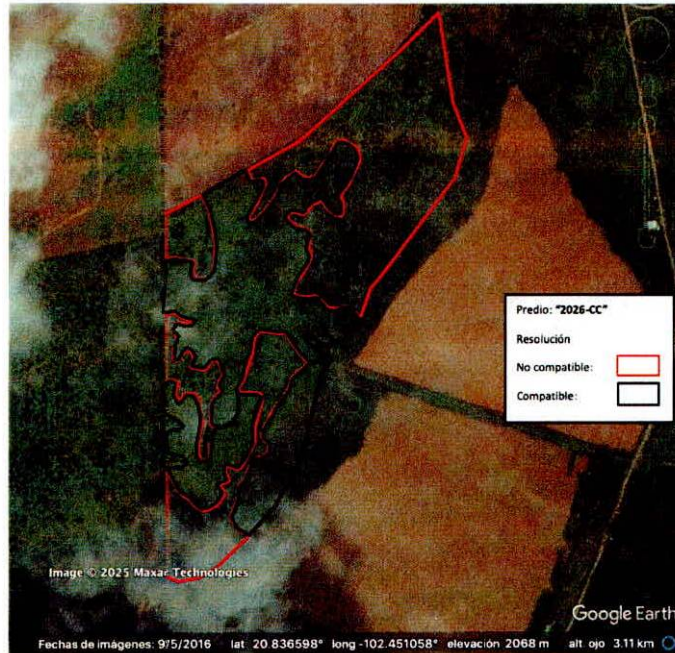
Figura 2. Imágenes de alta resolución, como evidencia para revisión de controversia de COMPATIBILIDAD en Predios estimados para el cultivo de agave. Color Natural año 2016.

La presente interpretación se hace con carácter informativo, no constituye ninguna autorización, dictamen, permiso, licencia o reconocimiento de hechos por parte de la Secretaría de Medio Ambiente y Desarrollo Territorial del Estado de Jalisco, por lo que será la autoridad correspondiente la encargada de la evaluación final del contenido, y en su caso, la autorización del trámite correspondiente.