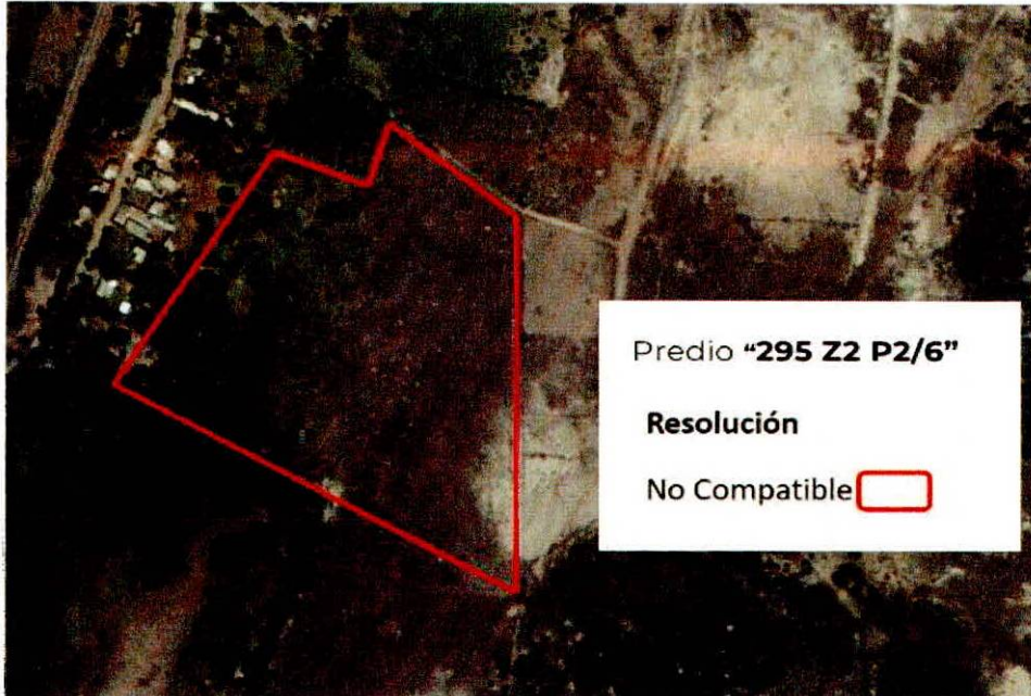
Figura 2. Imágenes de alta resolución, como evidencia para revisión de controversia de COMPATIBILIDAD en Predios estimados para el cultivo de agave. Color Natural año 2016.

La presente interpretación se hace con carácter informativo, no constituye ninguna autorización, dictamen, permiso, licencia o reconocimiento de hechos por parte de la Secretaría de Medio Ambiente y Desarrollo Territorial del Estado de Jalisco, por lo que será la autoridad correspondiente la encargada de la evaluación final del contenido, y en su caso, la autorización del trámite correspondiente.