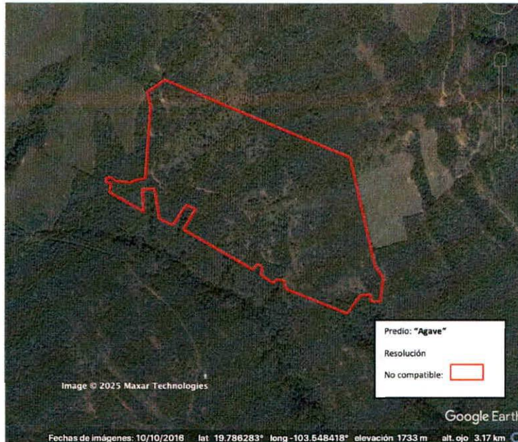
Figura 2. Imágenes de alta resolución, como evidencia para revisión de controversia de COMPATIBILIDAD en Predios estimados para el cultivo de agave. Color Natural año 2016.

La presente interpretación se hace con carácter informativo, no constituye ninguna autorización, dictamen, permiso, licencia o reconocimiento de hechos por parte de la Secretaría de Medio Ambiente y Desarrollo Territorial del Estado de Jalisco, por lo que será la autoridad correspondiente la encargada de la evaluación final del contenido, y en su caso, la autorización del trámite correspondiente.