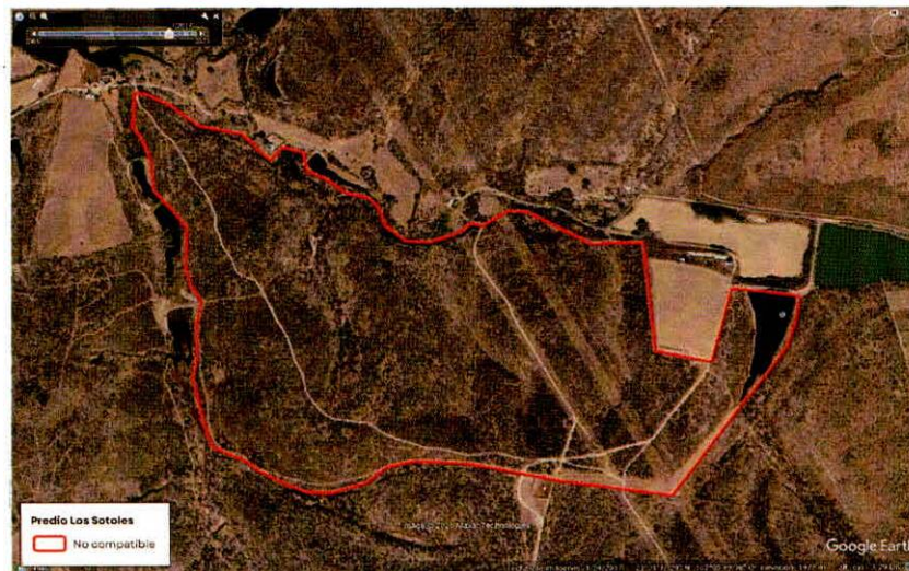
Figura 2. Imágenes de alta resolución, como evidencia para revisión de controversia de COMPATIBILIDAD en Predios estimados para el cultivo de agave. Color Natural año 2017.

Con base en la revisión técnica del predio Predio Los Sotoles resulta Conflicto , ya que cuenta con 0.00 % de área elegible para el cultivo de agave.