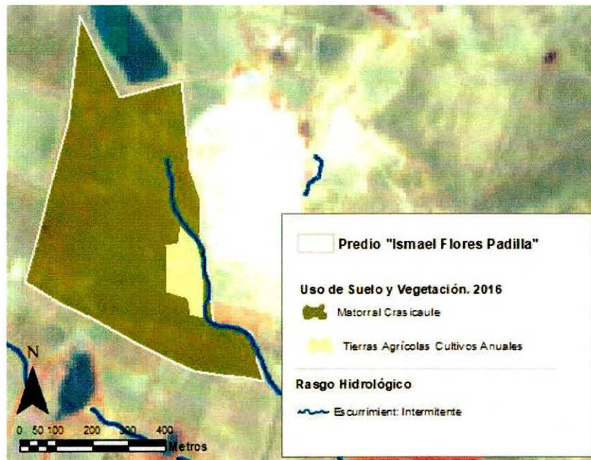
Figura 1. Capas vectoriales, como evidencia para revisión de controversia de COMPATIBILIDAD en Predios estimados para el cultivo de agave.