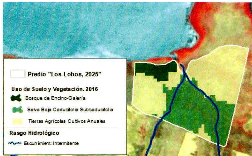
Figura 1. Capas vectoriales, como evidencia para revisión de controversia de COMPATIBILIDAD en Predios estimados para el cultivo de agave.