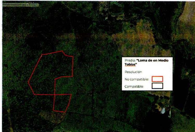
Figura 2. Imágenes de alta resolución, como evidencia para revisión de controversia de COMPATIBILIDAD en Predios estimados para el cultivo de agave. Color Natural año 2016.

La presente interpretación se hace con carácter informativo, no constituye ninguna autorización, dictamen, permiso, licencia o reconocimiento de hechos por parte de la Secretaría de Medio Ambiente y Desarrollo Territorial del Estado de Jalisco, por lo que será la autoridad correspondiente la encargada de la evaluación final del contenido, y en su caso, la autorización del trámite correspondiente.