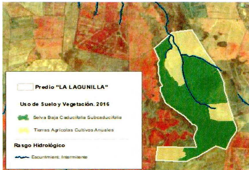
Figura 1. Capas vectoriales, como evidencia para revisión de controversia de COMPATIBILIDAD en Predios estimados para el cultivo de agave.