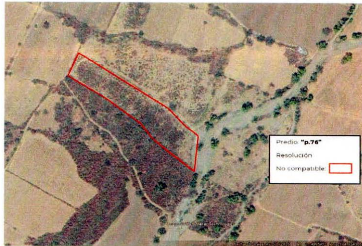
Figura 2. Imágenes de alta resolución, como evidencia para revisión de controversia de COMPATIBILIDAD en Predios estimados para el cultivo de agave. Color Natural año 2016.

La presente interpretación se hace con carácter informativo, no constituye ninguna autorización, dictamen, permiso, licencia o reconocimiento de hechos por parte de la Secretaría de Medio Ambiente y Desarrollo Territorial del Estado de Jalisco, por lo que será la autoridad correspondiente la encargada de la evaluación final del contenido, y en su caso, la autorización del trámite correspondiente.