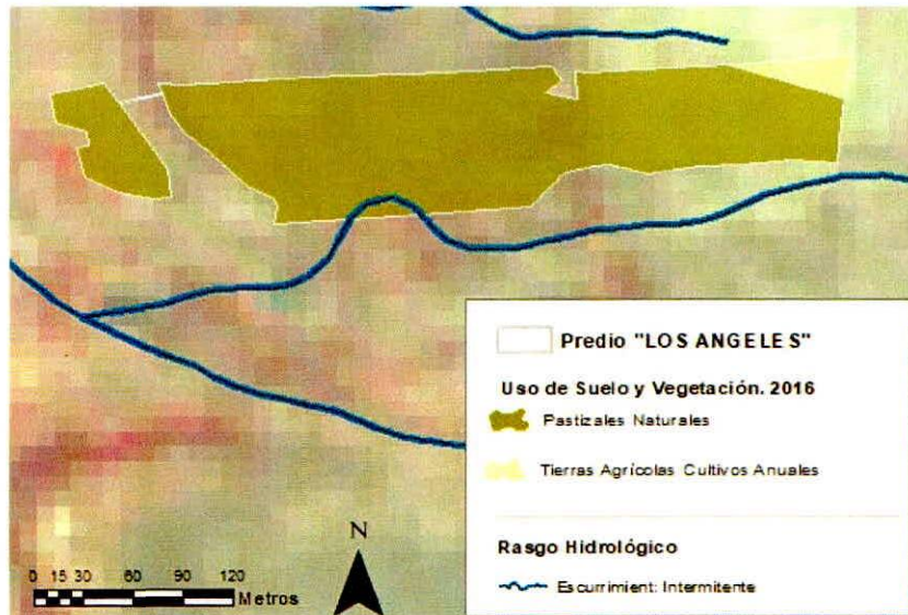
Figura 1. Capas vectoriales, como evidencia para revisión de controversia de COMPATIBILIDAD en Predios estimados para el cultivo de agave.