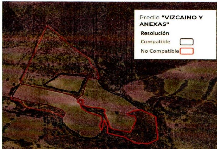
Figura 2. Imágenes de alta resolución, como evidencia para revisión de controversia de COMPATIBILIDAD en Predios estimados para el cultivo de agave. Color Natural año 2016.

La presente interpretación se hace con carácter informativo, no constituye ninguna autorización, dictamen, permiso, licencia o reconocimiento de hechos por parte de la Secretaría de Medio Ambiente y Desarrollo Territorial del Estado de Jalisco, por lo que será la autoridad correspondiente la encargada de la evaluación final del contenido, y en su caso, la autorización del trámite correspondiente.