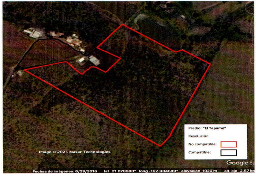
Figura 2. Imágenes de alta resolución, como evidencia para revisión de controversia de COMPATIBILIDAD en Predios estimados para el cultivo de agave. Color Natural año 2016.

La presente interpretación se hace con carácter informativo, no constituye ninguna autorización, dictamen, permiso, licencia o reconocimiento de hechos por parte de la Secretaría de Medio Ambiente y Desarrollo Territorial del Estado de Jalisco, por lo que será la autoridad correspondiente la encargada de la evaluación final del contenido, y en su caso, la autorización del trámite correspondiente.