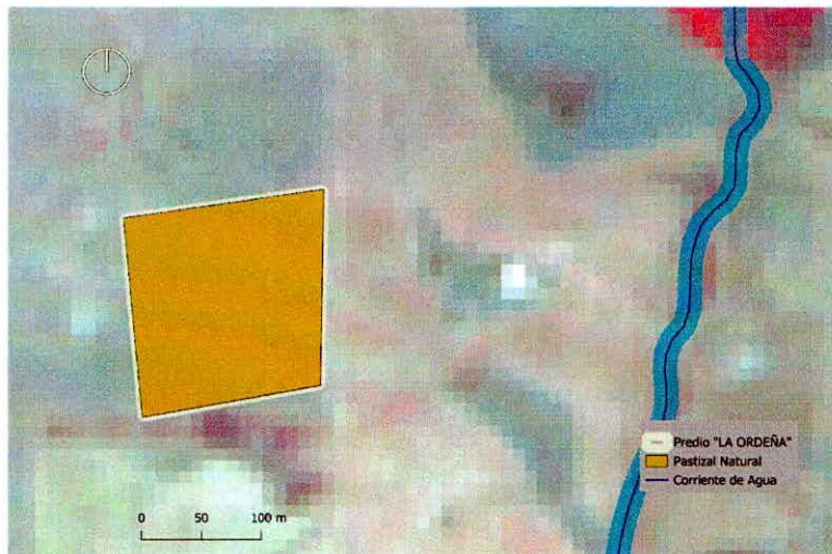
Figura 1. Capas vectoriales, como evidencia para revisión de controversia de COMPATIBILIDAD en Predios estimados para el cultivo de agave.