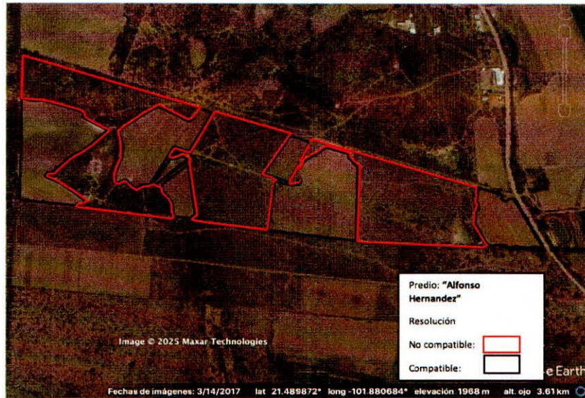
Figura 2. Imágenes de alta resolución, como evidencia para revisión de controversia de COMPATIBILIDAD en Predios estimados para el cultivo de agave. Color Natural año 2016.

La presente interpretación se hace con carácter informativo, no constituye ninguna autorización, dictamen, permiso, licencia o reconocimiento de hechos por parte de la Secretaría de Medio Ambiente y Desarrollo Territorial del Estado de Jalisco, por lo que será la autoridad correspondiente la encargada de la evaluación final del contenido, y en su caso, la autorización del trámite correspondiente.