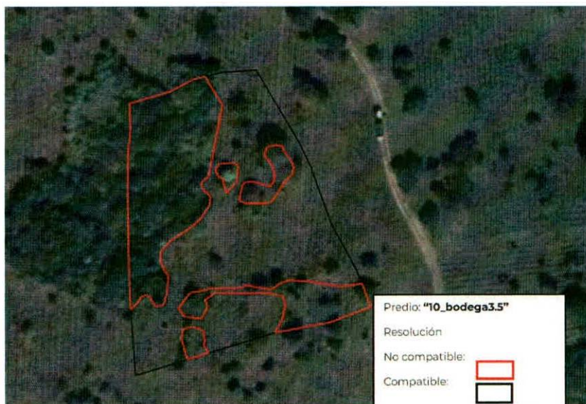
Figura 2. Imágenes de alta resolución, como evidencia para revisión de controversia de COMPATIBILIDAD en Predios estimados para el cultivo de agave. Color Natural año 2016.

Con base en la revisión técnica del predio 10_bodega3.5 resulta Conflicto potencial , ya que cuenta con 58.49 % de área elegible para el cultivo de agave.