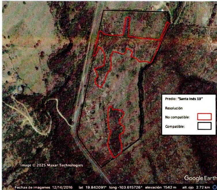
Figura 2. Imágenes de alta resolución, como evidencia para revisión de controversia de COMPATIBILIDAD en Predios estimados para el cultivo de agave. Color Natural año 2016.

La presente interpretación se hace con carácter informativo, no constituye ninguna autorización, dictamen, permiso, licencia o reconocimiento de hechos por parte de la Secretaría de Medio Ambiente y Desarrollo Territorial del Estado de Jalisco, por lo que será la autoridad correspondiente la encargada de la evaluación final del contenido, y en su caso, la autorización del trámite correspondiente.