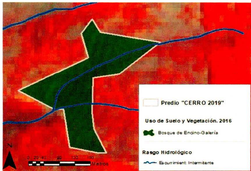
Figura 1. Capas vectoriales, como evidencia para revisión de controversia de COMPATIBILIDAD en Predios estimados para el cultivo de agave.