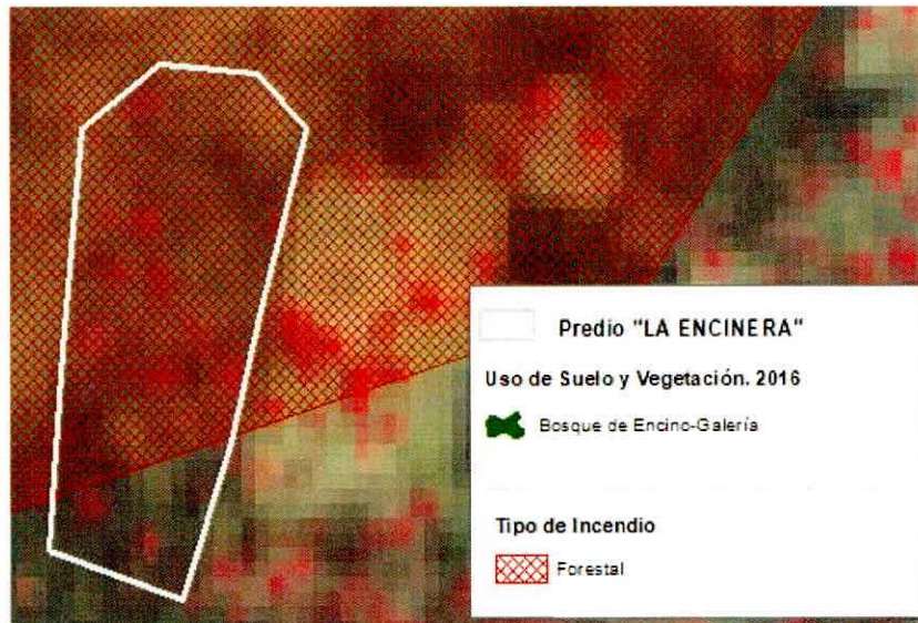
Figura 1. Capas vectoriales, como evidencia para revisión de controversia de COMPATIBILIDAD en Predios estimados para el cultivo de agave.