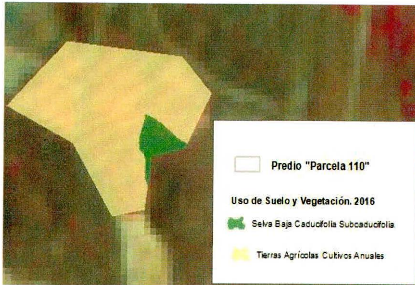
Figura 1. Capas vectoriales, como evidencia para revisión de controversia de COMPATIBILIDAD en Predios estimados para el cultivo de agave.