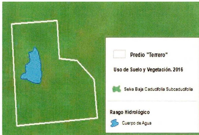
Figura 1. Capas vectoriales, como evidencia para revisión de controversia de COMPATIBILIDAD en Predios estimados para el cultivo de agave.