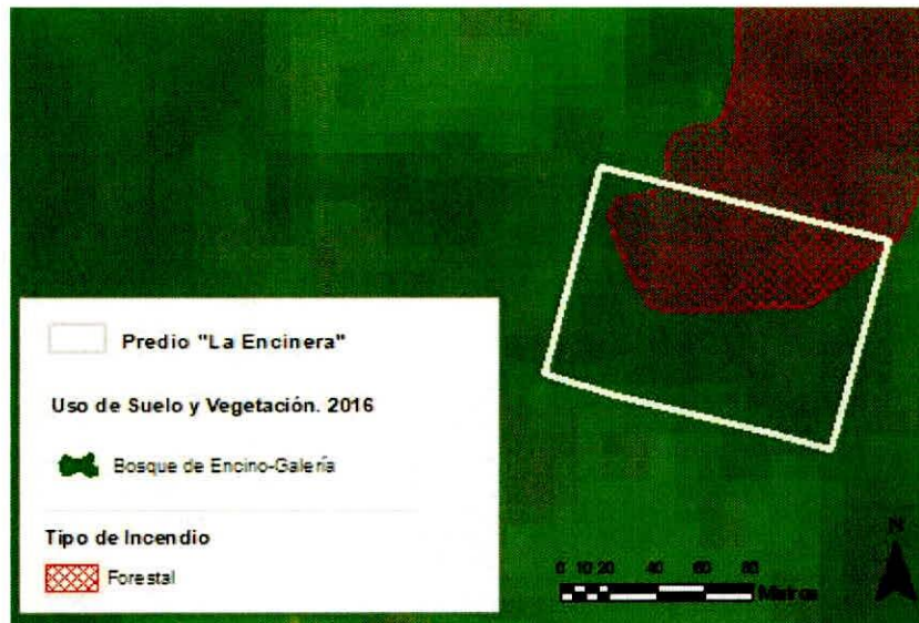
Figura 1. Capas vectoriales, como evidencia para revisión de controversia de COMPATIBILIDAD en Predios estimados para el cultivo de agave.