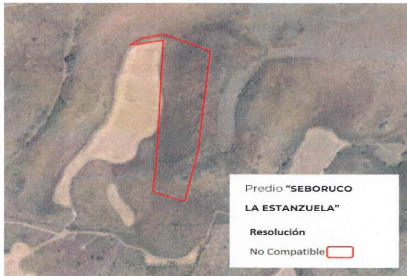
Figura 2. Imágenes de alta resolución, como evidencia para revisión de controversia de COMPATIBILIDAD en Predios estimados para el cultivo de agave. Color Natural año 2016.

La presente interpretación se hace con carácter informativo, no constituye ninguna autorización, dictamen, permiso, licencia o reconocimiento de hechos por parte de la Secretaría de Medio Ambiente y Desarrollo Territorial del Estado de Jalisco, por lo que será la autoridad correspondiente la encargada de la evaluación final del contenido, y en su caso, la autorización del trámite correspondiente.