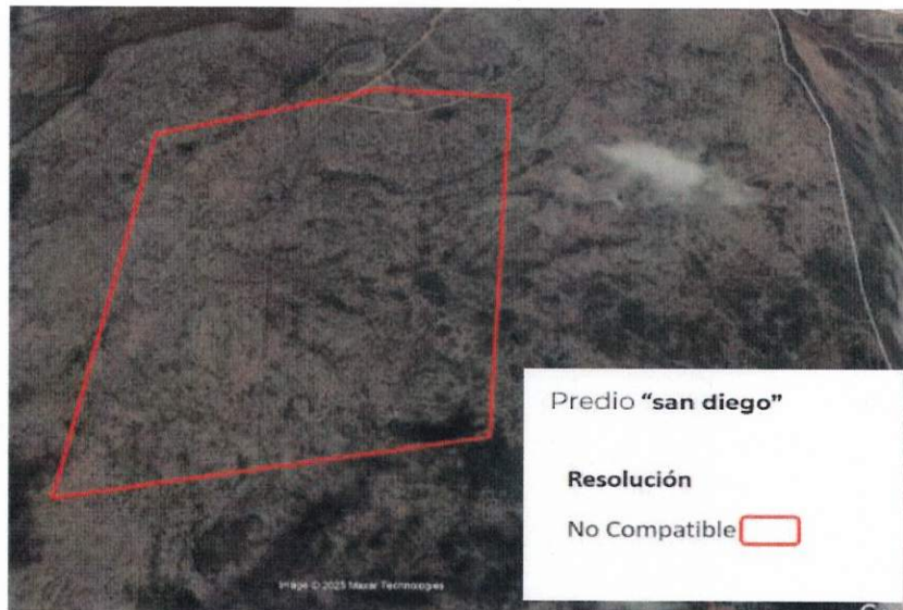
Figura 2. Imágenes de alta resolución, como evidencia para revisión de controversia de COMPATIBILIDAD en Predios estimados para el cultivo de agave. Color Natural año 2016.

Con base en la revisión técnica del predio san diego resulta Conflicto , ya que cuenta con 0.00 % de área elegible para el cultivo de agave.