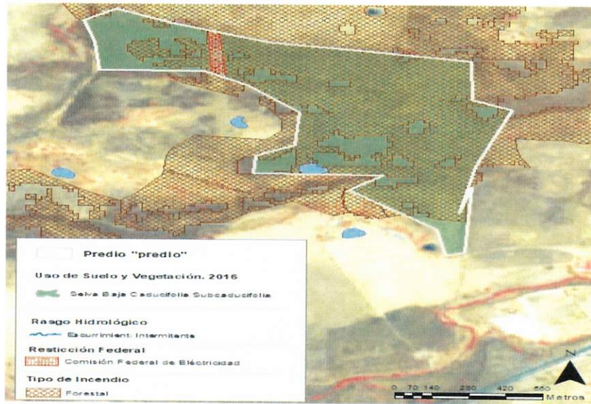
Figura 1. Capas vectoriales, como evidencia para revisión de controversia de COMPATIBILIDAD en Predios estimados para el cultivo de agave.