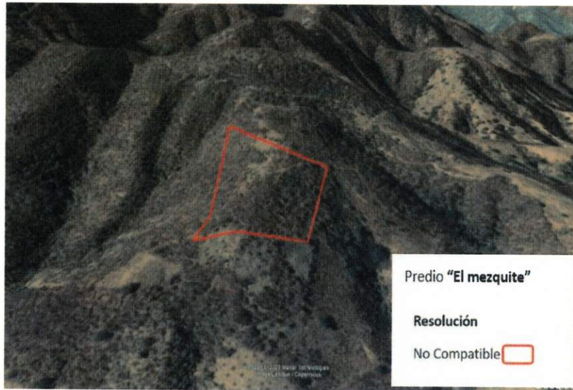
Figura 2. Imágenes de alta resolución, como evidencia para revisión de controversia de COMPATIBILIDAD en Predios estimados para el cultivo de agave. Color Natural año 2016.

La presente interpretación se hace con carácter informativo, no constituye ninguna autorización, dictamen, permiso, licencia o reconocimiento de hechos por parte de la Secretaría de Medio Ambiente y Desarrollo Territorial del Estado de Jalisco, por lo que será la autoridad correspondiente la encargada de la evaluación final del contenido, y en su caso, la autorización del trámite correspondiente.