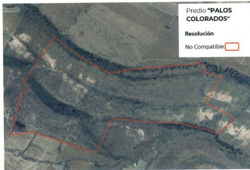
Figura 2. Imágenes de alta resolución, como evidencia para revisión de controversia de COMPATIBILIDAD en Predios estimados para el cultivo de agave. Color Natural año 2016.

La presente interpretación se hace con carácter informativo, no constituye ninguna autorización, dictamen, permiso, licencia o reconocimiento de hechos por parte de la Secretaría de Medio Ambiente y Desarrollo Territorial del Estado de Jalisco, por lo que será la autoridad correspondiente la encargada de la evaluación final del contenido, y en su caso, la autorización del trámite correspondiente.