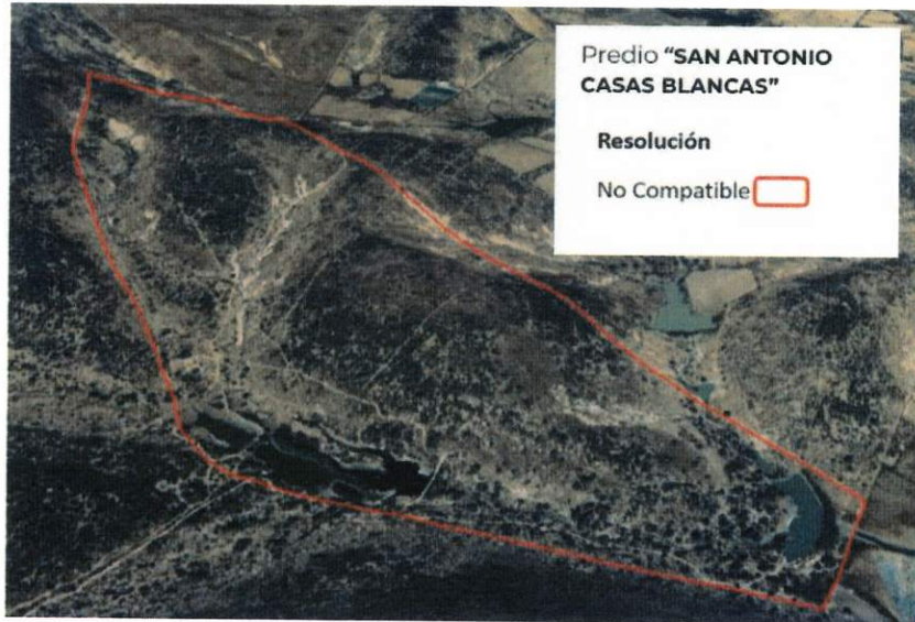
Figura 2. Imágenes de alta resolución, como evidencia para revisión de controversia de COMPATIBILIDAD en Predios estimados para el cultivo de agave. Color Natural año 2016.

La presente interpretación se hace con carácter informativo, no constituye ninguna autorización, dictamen, permiso, licencia o reconocimiento de hechos por parte de la Secretaría de Medio Ambiente y Desarrollo Territorial del Estado de Jalisco, por lo que será la autoridad correspondiente la encargada de la evaluación final del contenido, y en su caso, la autorización del trámite correspondiente.