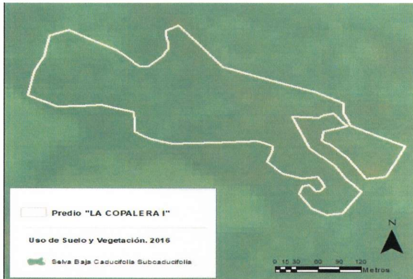
Figura 1. Capas vectoriales, como evidencia para revisión de controversia de COMPATIBILIDAD en Predios estimados para el cultivo de agave.