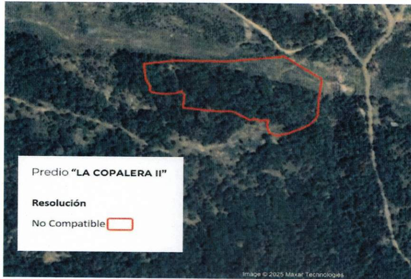
Figura 2. Imágenes de alta resolución, como evidencia para revisión de controversia de COMPATIBILIDAD en Predios estimados para el cultivo de agave. Color Natural año 2016.

La presente interpretación se hace con carácter informativo, no constituye ninguna autorización, dictamen, permiso, licencia o reconocimiento de hechos por parte de la Secretaría de Medio Ambiente y Desarrollo Territorial del Estado de Jalisco, por lo que será la autoridad correspondiente la encargada de la evaluación final del contenido, y en su caso, la autorización del trámite correspondiente.