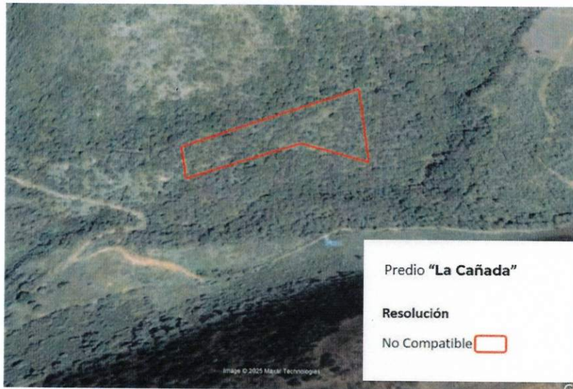
Figura 2. Imágenes de alta resolución, como evidencia para revisión de controversia de COMPATIBILIDAD en Predios estimados para el cultivo de agave. Color Natural año 2016.

La presente interpretación se hace con carácter informativo, no constituye ninguna autorización, dictamen, permiso, licencia o reconocimiento de hechos por parte de la Secretaría de Medio Ambiente y Desarrollo Territorial del Estado de Jalisco, por lo que será la autoridad correspondiente la encargada de la evaluación final del contenido, y en su caso, la autorización del trámite correspondiente.