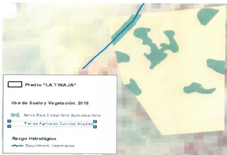
Figura 1. Capas vectoriales, como evidencia para revisión de controversia de COMPATIBILIDAD en Predios estimados para el cultivo de agave.