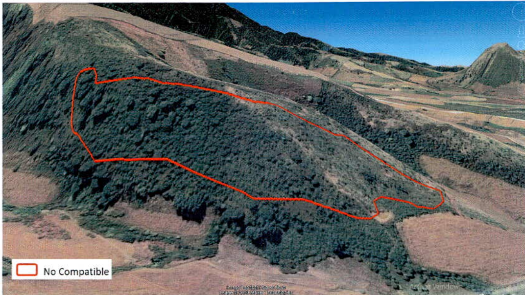
Figura 1.a. Imágenes de alta resolución, como evidencia para revisión de controversia de COMPATIBILIDAD en Predios estimados para el cultivo de agave. Color Natural año 2016.