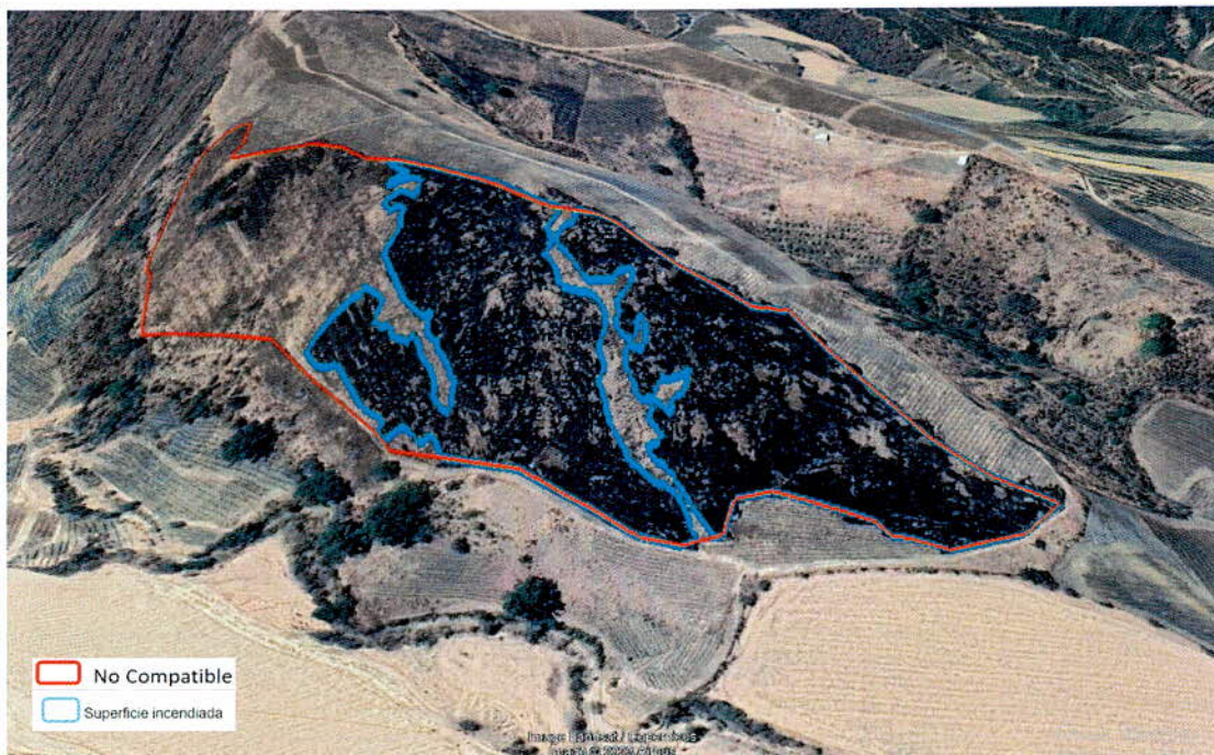
Figura 1.a. Imágenes de alta resolución, como evidencia de incendio 2023. Color Natural.