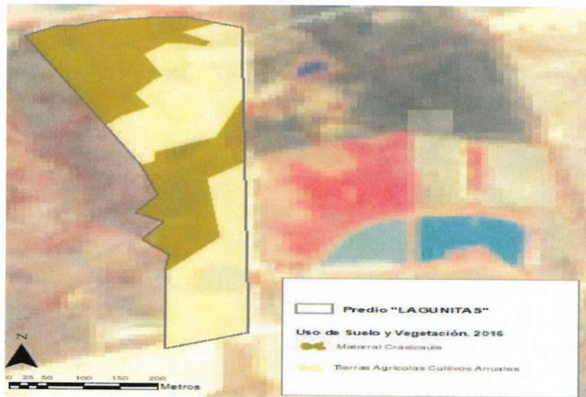
Figura 1. Capas vectoriales, como evidencia para revisión de controversia de COMPATIBILIDAD en Predios estimados para el cultivo de agave.