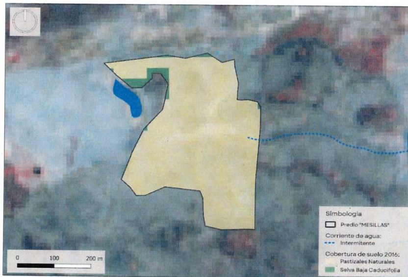
Figura 1. Capas vectoriales, como evidencia para revisión de controversia de COMPATIBILIDAD en Predios estimados para el cultivo de agave.