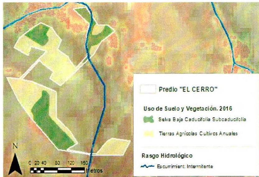
Figura 1. Capas vectoriales, como evidencia para revisión de controversia de COMPATIBILIDAD en Predios estimados para el cultivo de agave.