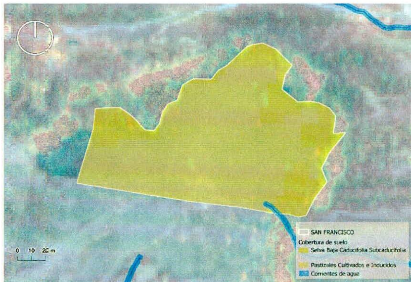
Figura 1. Capas vectoriales, como evidencia para revisión de controversia de COMPATIBILIDAD en Predios estimados para el cultivo de agave.