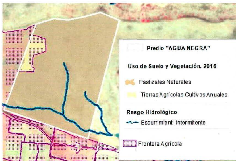
Figura 1. Capas vectoriales, como evidencia para revisión de controversia de COMPATIBILIDAD en Predios estimados para el cultivo de agave.