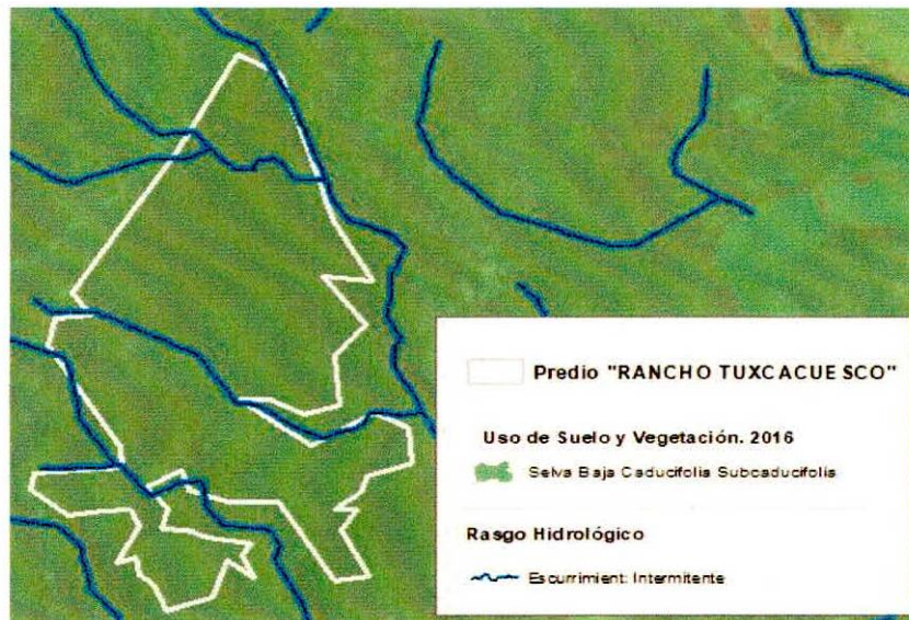
Figura 1. Capas vectoriales, como evidencia para revisión de controversia de COMPATIBILIDAD en Predios estimados para el cultivo de agave.