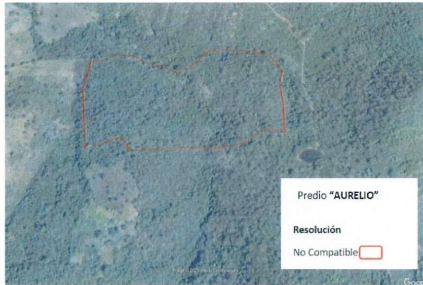
Figura 2. Imágenes de alta resolución, como evidencia para revisión de controversia de COMPATIBILIDAD en Predios estimados para el cultivo de agave. Color Natural año 2016.

La presente interpretación se hace con carácter informativo, no constituye ninguna autorización, dictamen, permiso, licencia o reconocimiento de hechos por parte de la Secretaría de Medio Ambiente y Desarrollo Territorial del Estado de Jalisco, por lo que será la autoridad correspondiente la encargada de la evaluación final del contenido, y en su caso, la autorización del trámite correspondiente.