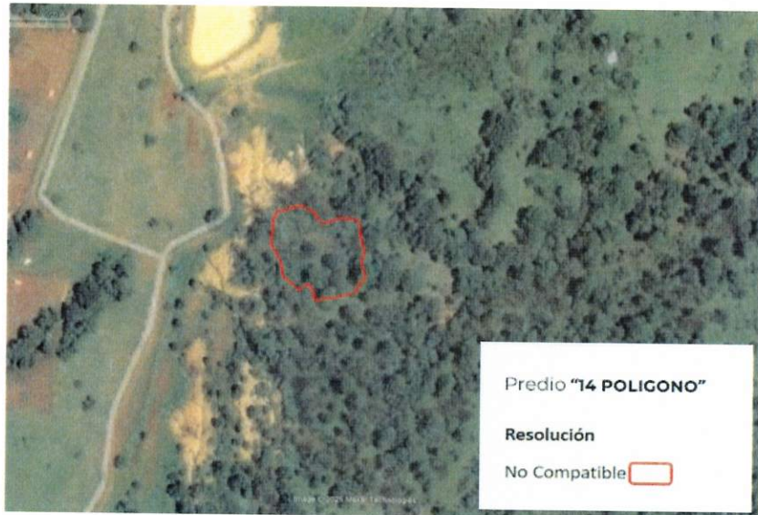
Figura 2. Imágenes de alta resolución, como evidencia para revisión de controversia de COMPATIBILIDAD en Predios estimados para el cultivo de agave. Color Natural año 2016.

Con base en la revisión técnica del predio 14 POLIGONO resulta Conflicto , ya que cuenta con 0.00 % de área elegible para el cultivo de agave.