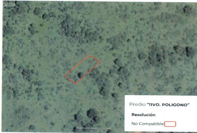
Figura 2. Imágenes de alta resolución, como evidencia para revisión de controversia de COMPATIBILIDAD en Predios estimados para el cultivo de agave. Color Natural año 2016.

La presente interpretación se hace con carácter informativo, no constituye ninguna autorización, dictamen, permiso, licencia o reconocimiento de hechos por parte de la Secretaría de Medio Ambiente y Desarrollo Territorial del Estado de Jalisco, por lo que será la autoridad correspondiente la encargada de la evaluación final del contenido, y en su caso, la autorización del trámite correspondiente.