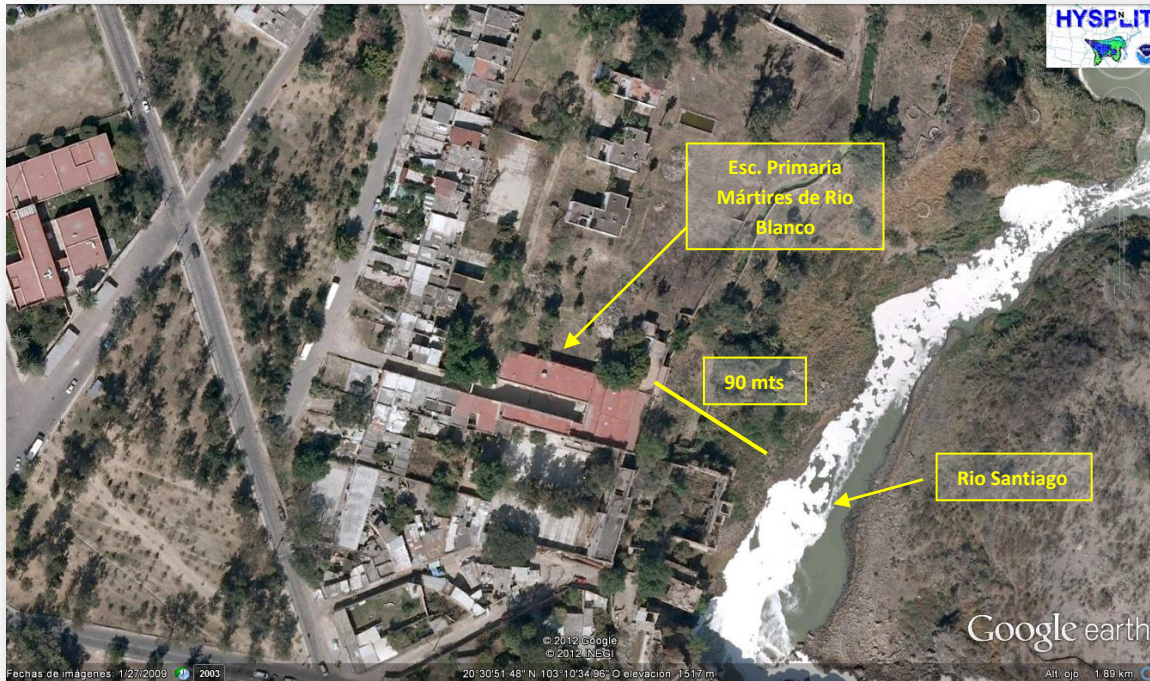
Figura 1. Ubicación Física de las Instalaciones del plantel educativo Primaria Mártires de Río Blanco, ubicada en el Municipio de El Salto.

En la Figura 1 se muestra la ubicación de la primaria Mártires de Río Blanco, colindante al Río Santiago, es importante recalcar que la cercanía con el río es de tan solo 90 mts.